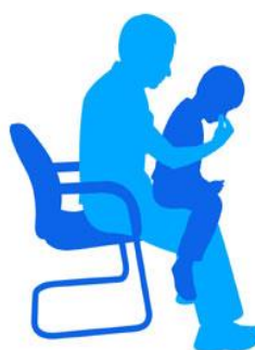
Child sits in adults lap